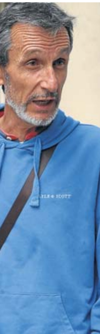
minación laboral por su edad.